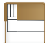
УПЕРЕТЬ ПЛИНТУС В БАЗУ В01 ИЛИ В02