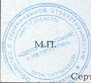
Схема сертификации: 3с.