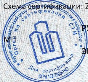
Схема сертификации: 2с